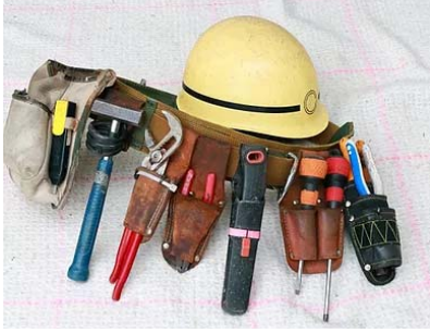
一般電気工事(ケーブル 電線管、工事、LED化他)