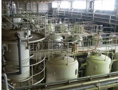
電気計装工事 (工場、プラント内他)