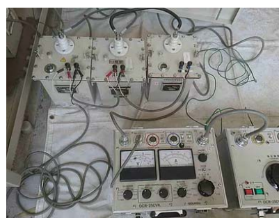
自家用工作物の定期点検