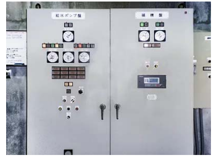
制御盤 設計、製造、検査、工事