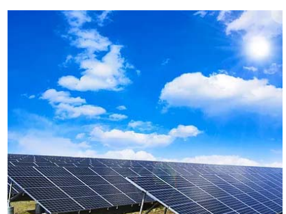
太陽光2019年問題対応 蓄電池設置