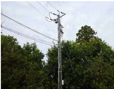
PAS、高圧ケーブル施工