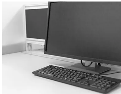
パソコン監視装置