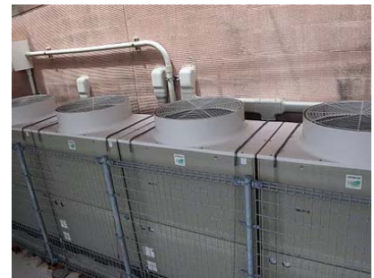
工場空調施工、更新